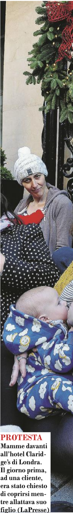
PROTESTA Mamme davanti all'hotel Claridge's di Londra. Il giorno prima, ad una cliente, era stato chiesto di coprirsi mentre allattava suo figlio